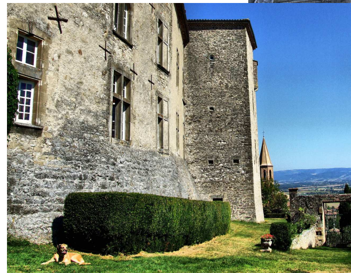
Le château de Montgey.