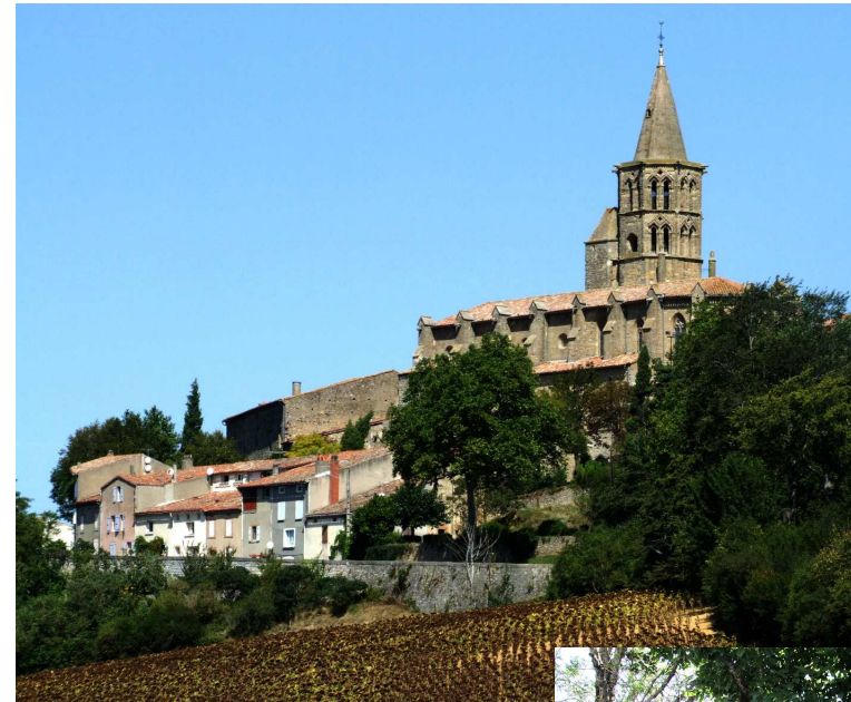
La Collégiale Notre-Dame de Saint-Félix.