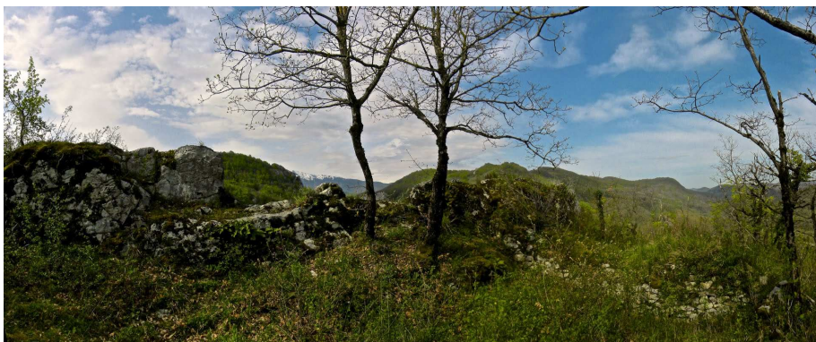
Ruines du castrum de Péréille.

Samedi 1 er juin 2013 Sur les pas des Bons hommes à Péréille et à Dun.